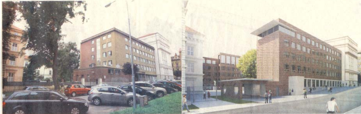
STARÁ A NOVÁ. Nová podoba filozofické fakulty zahrnuje také přístavbu ke vstupní části areálu. Největší změny se dočká takzvaný trakt B2, který je umítl areálu. Foto: Deník/Attila Racek a vizualizace: Masarykova univerzita

Filozofickou fakultu Masarykovy univerzity Brno čeká proměna. Pokud získá evropské peníze, postaví novou budovu a další opravy