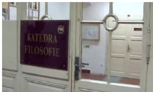
Katedra filozofie v Brně

Brno – Brněnská filozofická fakulta konečně získá reprezentativní prostory. Zázemí pro studenty humanitních oborů je tu dlouhodobě nevyhovující. Půlmiliardová dotace umožní rozsáhlou rekonstrukci, na kterou čekají nejen studenti. Dotace by měla pomoci fakultě uvést areál do vyhovujícího stavu. Je totiž poslední fakultou, která ještě nebyla zrekonstruována. Pokud půjde vše podle plánu, bude rekonstrukce dokončena v roce 2014.