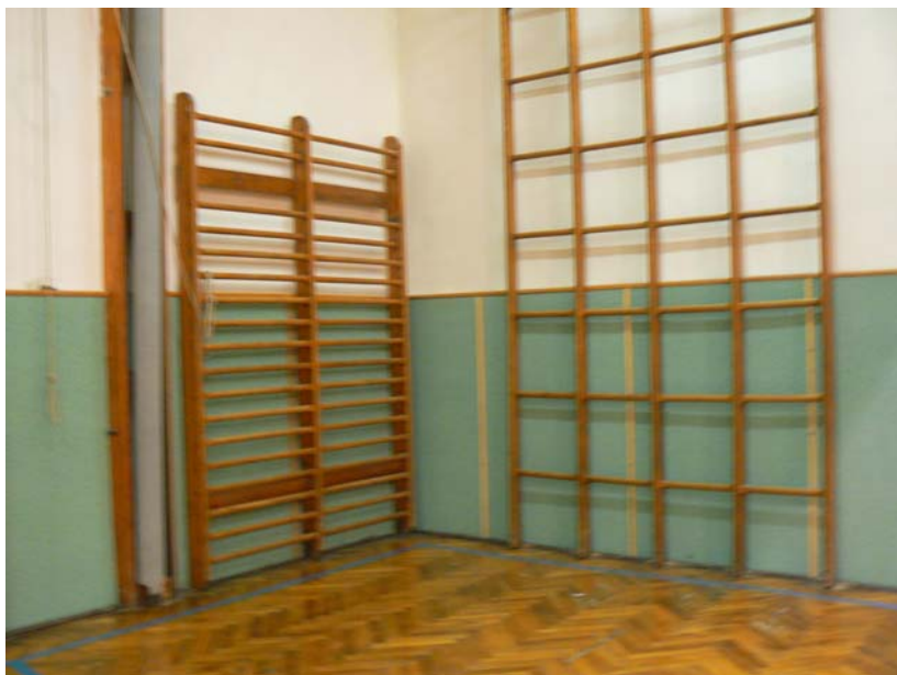
Laďovy oblíbené ribstoly