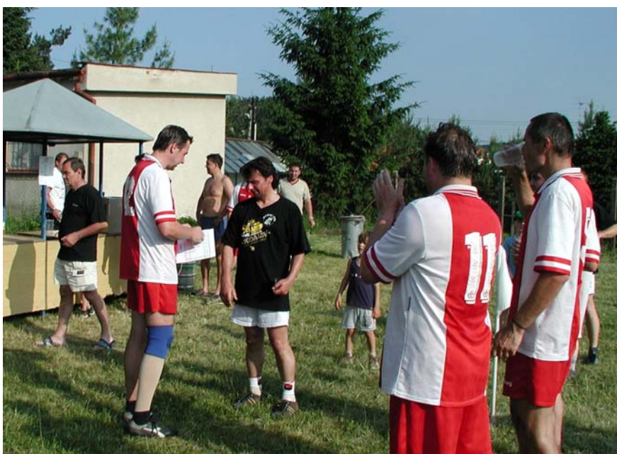
Lad'a domlouvá výsledek