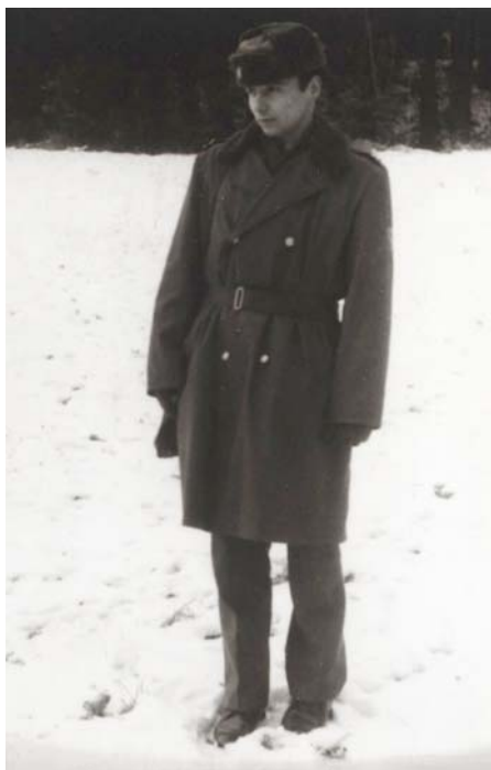
Laďa skepticky obhlíží zabezpečení západní hranice