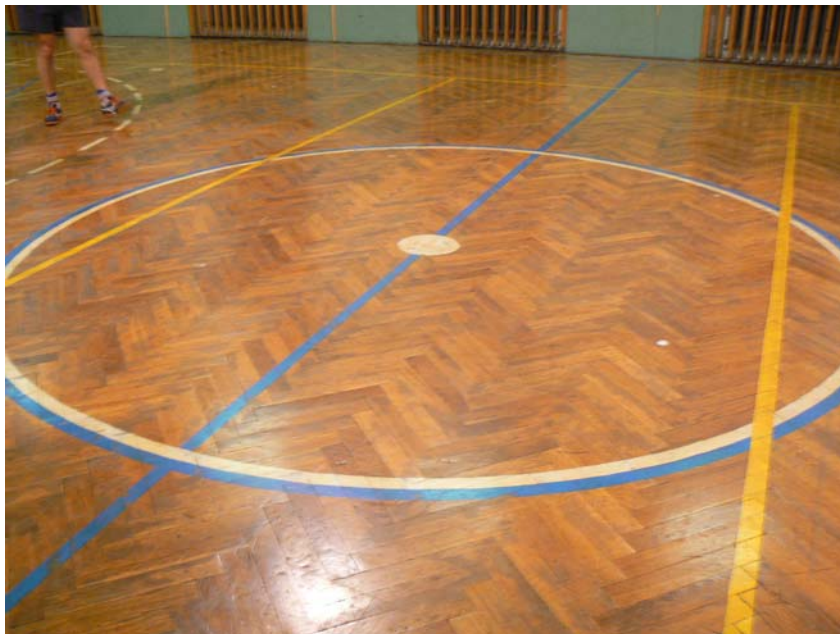
Lad'ova oblíbená palubovka