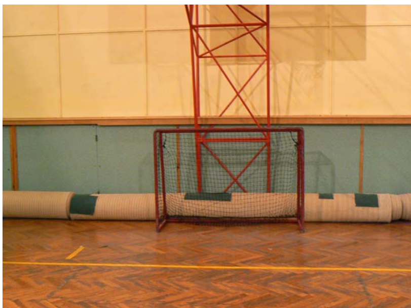
Laďova oblíbená branka