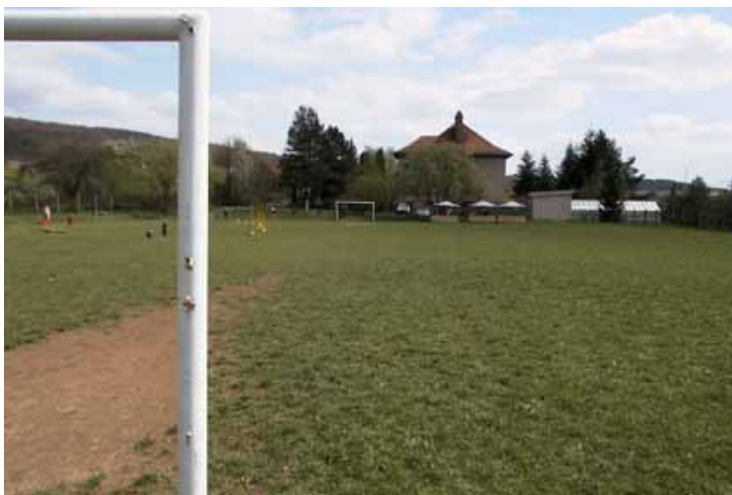
Jedna z šesti Csaplárových obrazových příloh

ozval se mi analytik csaplár s nejaktuálnějšími informacemi týkajícími se kanického turnaje. vzhledem k tomu, že sleduje pouze týmy z absolutní světové špičky, nemá žádné informace o účastnících vyjma nás, a ty už poskytl všem soupeřům. u těchto prý zavládlo intenzivní zdesení a zoufalé shánění ochranných pomůcek. jediné, co mi mohl nabídnout jsou snímky exteriéru hrsti za školou a ty vám posílám. byl jsem se tam podívat a je to klasické drnoviště, neprůlis rovne. je tam ale víc trávy než pod palakem. s detailního snímku vzácně pampelisky pan csaplár usoudil, že nejlepší bude použít obutí s kolíky typu BX254/WZ, zaručující nejlepší protiskluzové podmínky. ze snímku našeho figuranta můžete usuzovat, jak velkou opici si lze v kanicích poridit (az po boji).