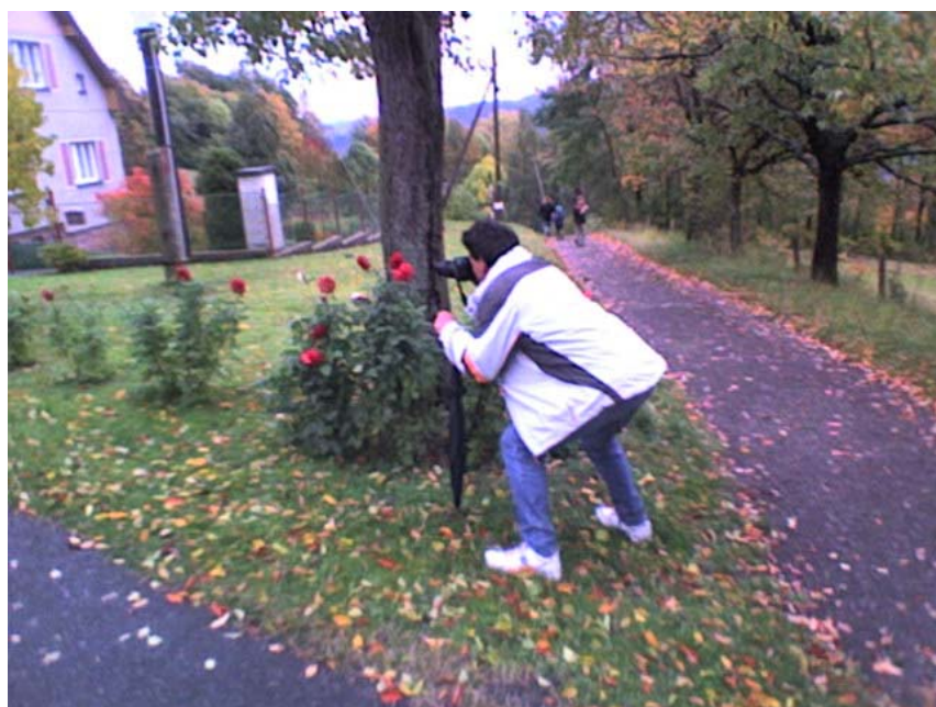
Lad'a jako paparazzi