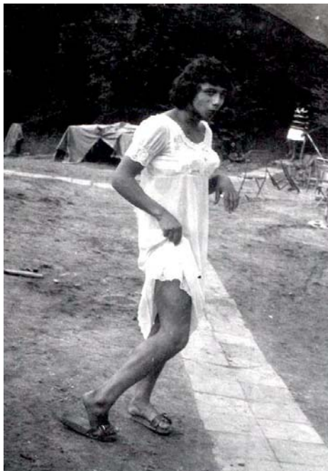
Prázdninové kurzy dospělosti