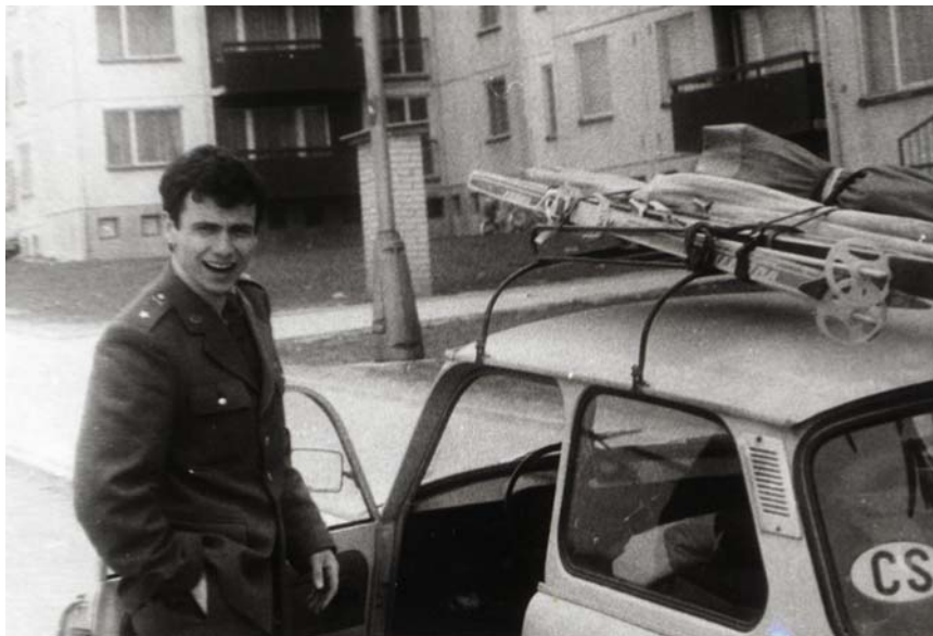
Lad'a řidičem a lyžařem