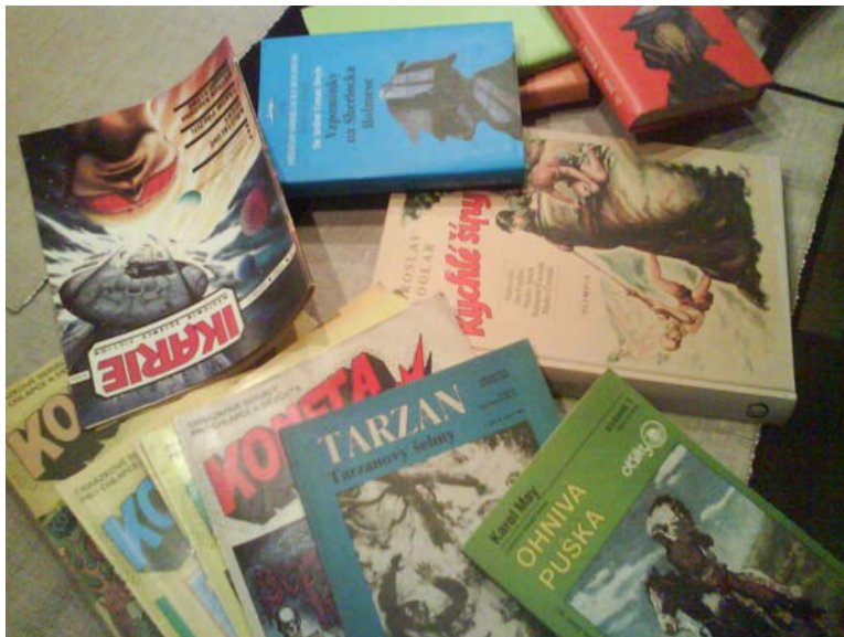
Oblíbená literatura na stole tajemníka fakulty