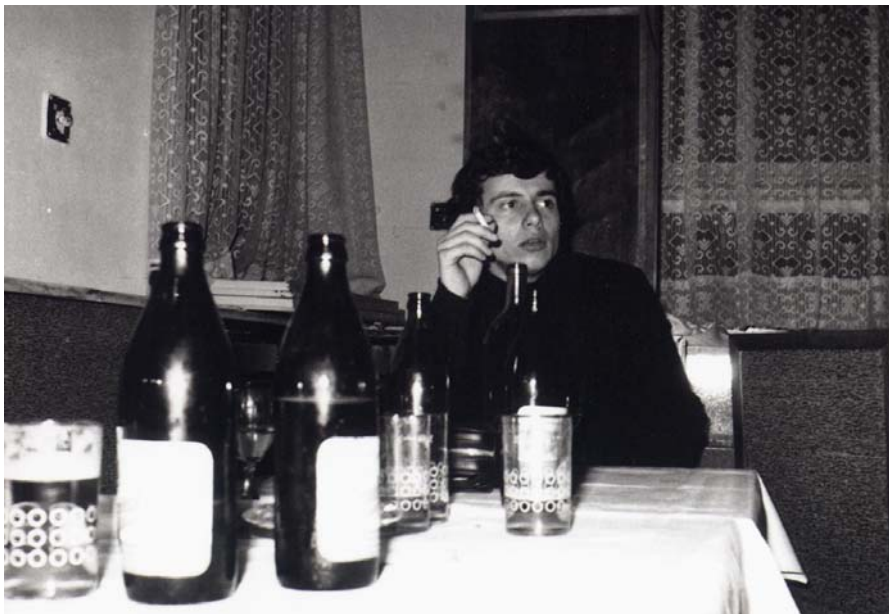
Lad'a v undergroundu